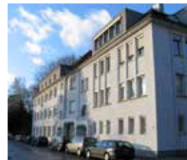
HfWU Campus Hauber

Die Hochschule für Wirtschaft und Umwelt Nürtingen-Geislingen (HfWU) ist eine von 24 Hochschulen für Angewandte Wissenschaften in Baden-Württemberg, die sich neben den Universitäten und Berufsakademien ein eigenes Profil als akademische Bildungseinrichtung erworben hat.