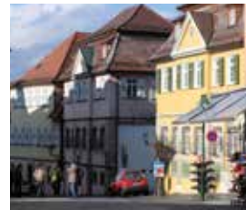
HfWU Campus Innenstadt